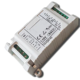
1-10V PWM control interface 24Vdc 120W IP20. Power supply not included F990B14A000