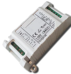
1-10V PWM control interface 24Vdc 120W IP20. Power supply not included F990B14A000