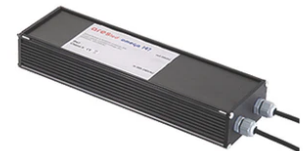
Power supply 24Vdc 50W / 120-240V IP67 Class II selv. Non Dimmable RF25755