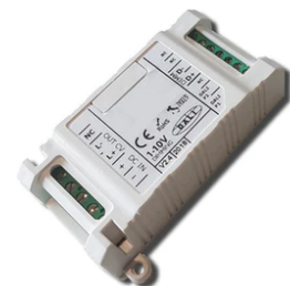
1-10V PWM control interface 24Vdc 120W IP20. Power supply not included F990B14A000