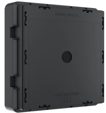
Box for installation F4303000