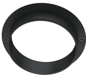
Spot visor F001Z010000