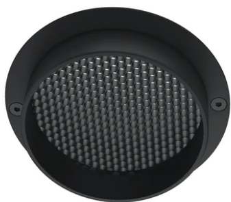
Spot visor with honeycomb F001Z030000