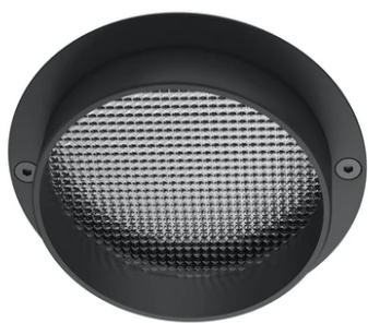
Spot visor with flood lens F001Z040000