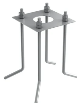
Base plate with bolt for Bellhop Pole with base version. F990G300000