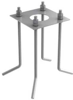
Base plate with bolt for Bellhop Pole with base version. F990G300000