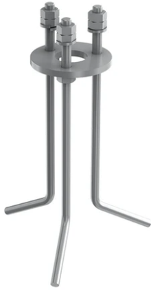
Base plate with bolt F003Z010000