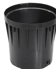
Box for installation F4599000