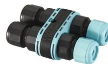
3/4 way terminal block 4 poles IP68 H2O stop. (ø5,5+12mm cable) F990C010000