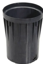
Box for installation F4598000