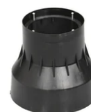
Box for installation F4597000