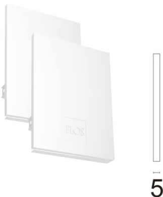
Metal cover. Suspension Up & Down. 35 mm (Colour White) 08.9056.40