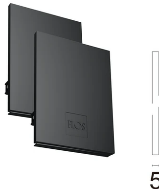
Metal cover. Suspension Up & Down. 35 mm 08.9056.06