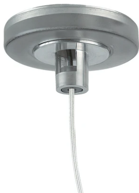
Power supply rose. Dali 08.0031.00.DA