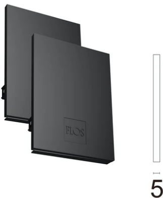
Metal cover. Suspension Up & Down. 35 mm (Colour Black) 08.9056.08