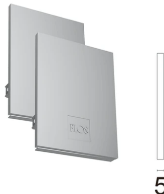
Metal cover. Suspension Up & Down. 35 mm (Colour Anodized Grey) 08.9056.02