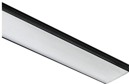
500 mm micro-prismatic diffuser. Highly efficient multilayer diffuser that, thanks to its unique microprismatic texture, provides a glare free UGR<19 light beam 08.0112.00