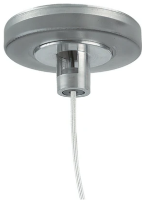
Power supply rose 08.0031.00