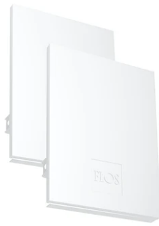
Metal cover. Suspension Up & Down. 35 mm (Colour Anodized Grey) 08.9056.02