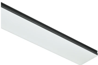
500 mm opal diffuser. Diffuse, glare free and uniform lighting throughout the room 08.0109.00