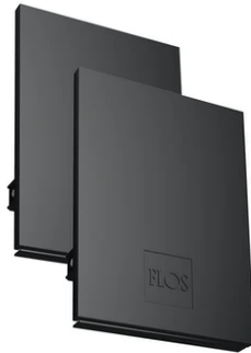
Metal cover. Suspension Up & Down. 35 mm 08.9056.06