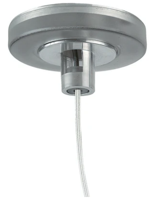
Power supply rose 08.0031.00