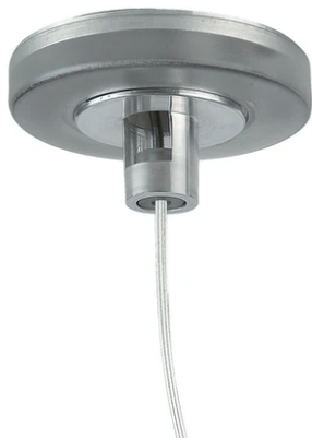
Power supply rose 08.0031.00