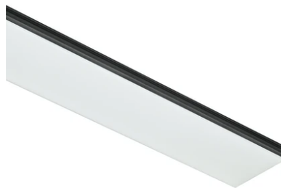
500 mm opal diffuser. Diffuse, glare free and uniform lighting throughout the room 08.0109.00