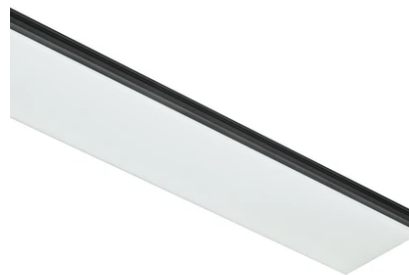
500 mm opal diffuser. Diffuse, glare free and uniform lighting throughout the room 08.0109.00