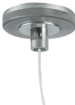
Power supply rose. Dali 08.0031.00.DA