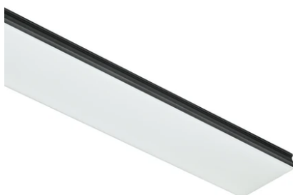
500 mm opal diffuser. Diffuse, glare free and uniform lighting throughout the room 08.0109.00