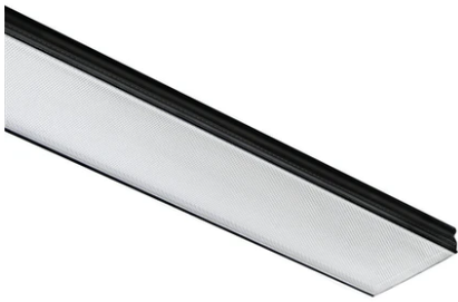
500 mm micro-prismatic diffuser. Highly efficient multilayer diffuser that, thanks to its unique microprismatic texture, provides a glare free UGR<19 light beam 08.0112.00