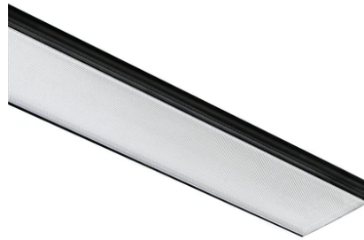
500 mm micro-prismatic diffuser. Highly efficient multilayer diffuser that, thanks to its unique microprismatic texture, provides a glare free UGR<19 light beam 08.0112.00