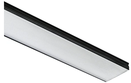
500 mm micro-prismatic diffuser. Highly efficient multilayer diffuser that, thanks to its unique microprismatic texture, provides a glare free UGR<19 light beam 08.0112.00