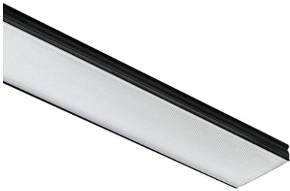
500 mm micro-prismatic diffuser. Highly efficient multilayer diffuser that, thanks to its unique microprismatic texture, provides a glare free UGR<19 light beam 08.0112.00