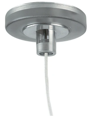
Power supply rose 08.0031.00