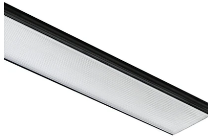
500 mm micro-prismatic diffuser. Highly efficient multilayer diffuser that, thanks to its unique microprismatic texture, provides a glare free UGR<19 light beam 08.0112.00