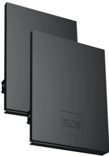
Metal cover. Suspension Up & Down. 35 mm (Colour White) 08.9056.40