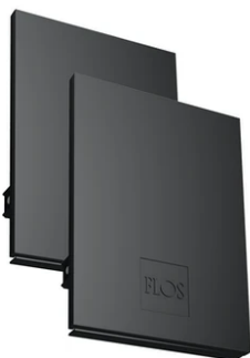
Metal cover. Suspension Up & Down. 35 mm (Colour Anodized Grey) 08.9056.02