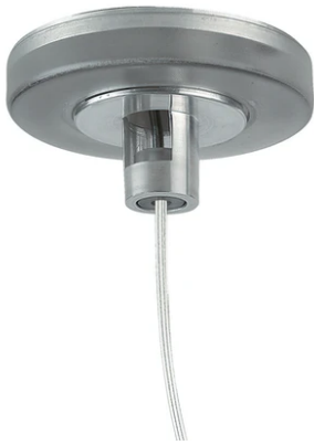
Power supply rose. Dali 08.0031.00.DA