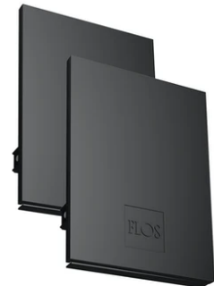
Metal cover. Suspension Up & Down. 35 mm (Colour White) 08.9056.40