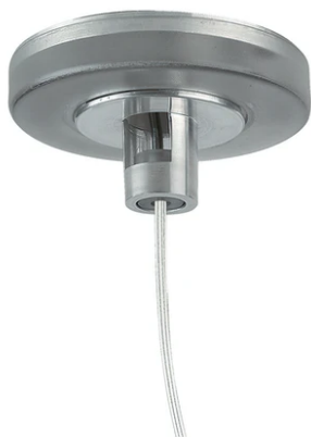
Power supply rose. Dali 08.0031.00.DA