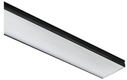
500 mm micro-prismatic diffuser. Highly efficient multilayer diffuser that, thanks to its unique microprismatic texture, provides a glare free UGR<19 light beam 08.0112.00