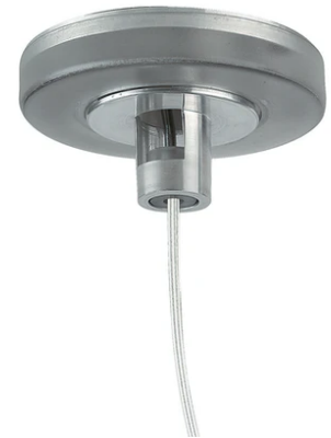
Metal cover. Suspension Up & Down. 35 mm (Colour White) 08.9056.40