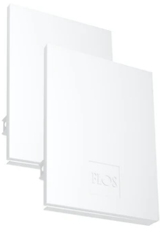
500 mm micro-prismatic diffuser. Highly efficient multilayer diffuser that, thanks to its unique microprismatic texture, provides a glare free UGR<19 light beam 08.0112.00