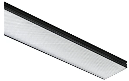
Metal cover. Suspension Up & Down. 35 mm 08.9056.06