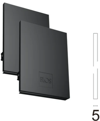
Metal cover. Suspension Up & Down. 35 mm