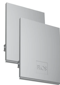
Metal cover. Suspension Up & Down. 35 mm (Colour White) 08.9056.40