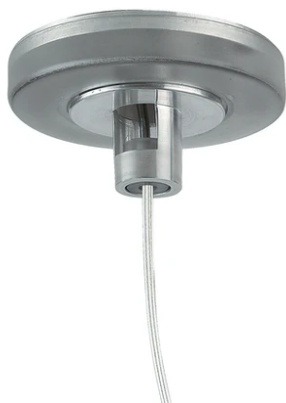
Power supply rose. Dali 08.0031.00.DA