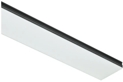
500 mm opal diffuser. Diffuse, glare free and uniform lighting throughout the room 08.0109.00