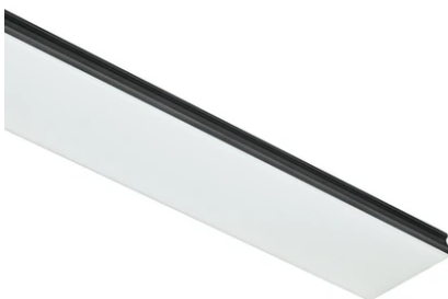
500 mm opal diffuser. Diffuse, glare free and uniform lighting throughout the room 08.0109.00