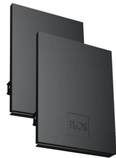
Metal cover. Suspension Up & Down. 35 mm 08.9056.06