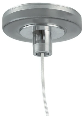
Power supply rose 08.0031.00