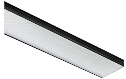
500 mm micro-prismatic diffuser. Highly efficient multilayer diffuser that, thanks to its unique microprismatic texture, provides a glare free UGR<19 light beam 08.0112.00