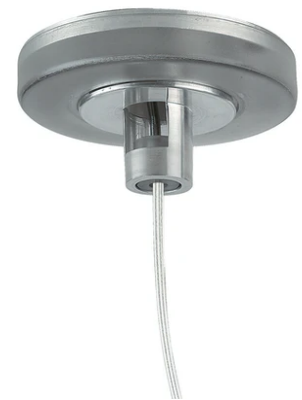
Power supply rose 08.0031.00