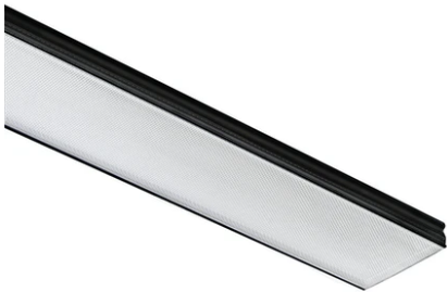
500 mm micro-prismatic diffuser. Highly efficient multilayer diffuser that, thanks to its unique microprismatic texture, provides a glare free UGR<19 light beam 08.0112.00