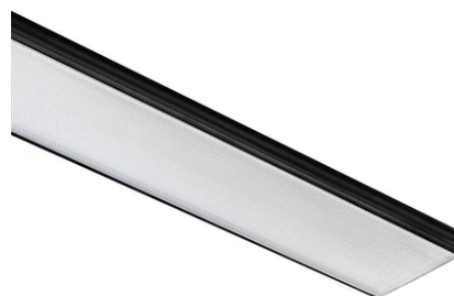
500 mm micro-prismatic diffuser. Highly efficient multilayer diffuser that, thanks to its unique microprismatic texture, provides a glare free UGR<19 light beam 08.0112.00