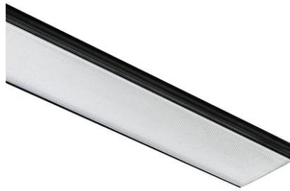
500 mm micro-prismatic diffuser. Highly efficient multilayer diffuser that, thanks to its unique microprismatic texture, provides a glare free UGR<19 light beam 08.0112.00