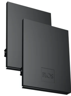
Metal cover. Suspension Up & Down. 35 mm 08.9056.06