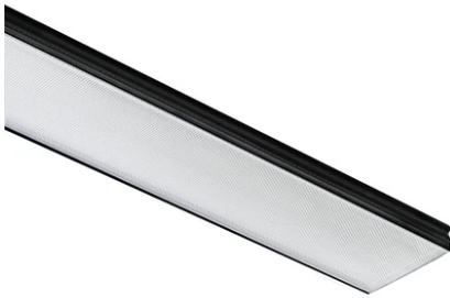
500 mm micro-prismatic diffuser. Highly efficient multilayer diffuser that, thanks to its unique microprismatic texture, provides a glare free UGR<19 light beam 08.0112.00