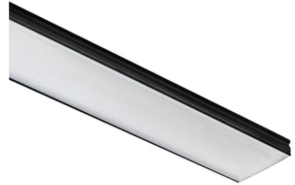
500 mm micro-prismatic diffuser. Highly efficient multilayer diffuser that, thanks to its unique microprismatic texture, provides a glare free UGR<19 light beam 08.0112.00