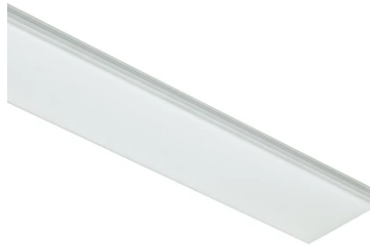
500 mm opal diffuser. Diffuse, glare free and uniform lighting throughout the room 08.0109.00