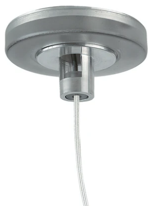
Power supply rose. Dali 08.0031.00.DA