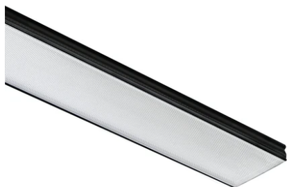
500 mm micro-prismatic diffuser. Highly efficient multilayer diffuser that, thanks to its unique microprismatic texture, provides a glare free UGR<19 light beam 08.0114.00