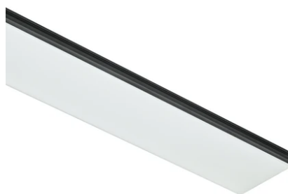
500 mm opal diffuser. Diffuse, glare free and uniform lighting throughout the room 08.0111.00