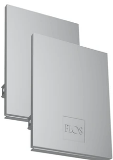
500 mm micro-prismatic diffuser. Highly efficient multilayer diffuser that, thanks to its unique microprismatic texture, provides a glare free UGR<19 light beam 08.0114.00