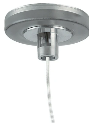
Metal cover. Suspension Up & Down. 100 mm (Colour Anodized Grey) 08.9058.02