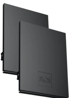
Power supply rose. Dali 08.0031.00.DA