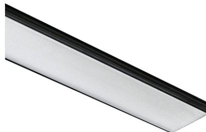
Metal cover. Suspension Up & Down. 100 mm 08.9058.06