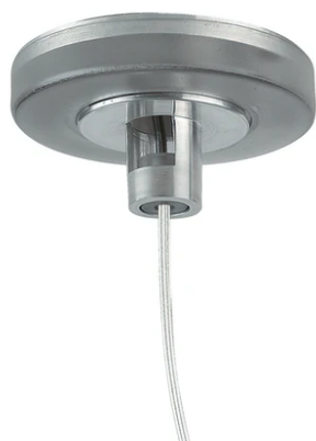
Power supply rose. Dali 08.0031.00.DA