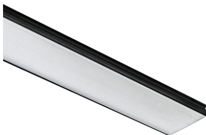
500 mm micro-prismatic diffuser. Highly efficient multilayer diffuser that, thanks to its unique microprismatic texture, provides a glare free UGR<19 light beam 08.0114.00