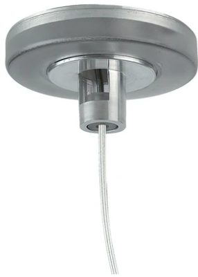
Power supply rose 08.0031.00