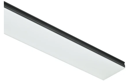
500 mm opal diffuser. Diffuse, glare free and uniform lighting throughout the room 08.0111.00