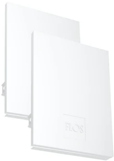
Metal cover. Suspension Up & Down. 100 mm (Colour Anodized Grey) 08.9058.02