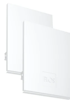
Metal cover. Suspension Up & Down. 100 mm (Colour Anodized Grey) 08.9058.02