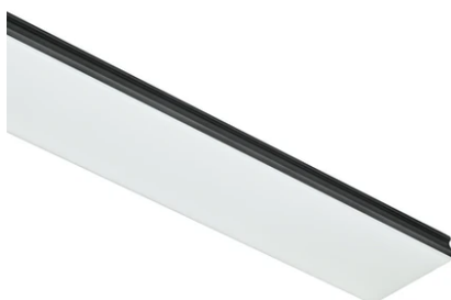
500 mm opal diffuser. Diffuse, glare free and uniform lighting throughout the room 08.0111.00