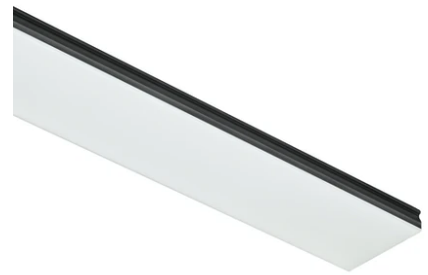
500 mm opal diffuser. Diffuse, glare free and uniform lighting throughout the room 08.0111.00