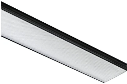
500 mm micro-prismatic diffuser. Highly efficient multilayer diffuser that, thanks to its unique microprismatic texture, provides a glare free UGR<19 light beam 08.0114.00