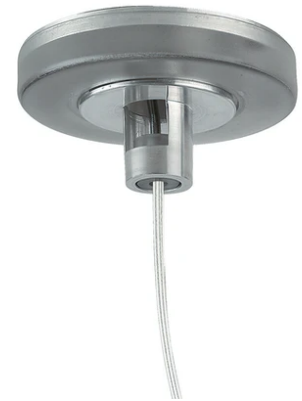
Power supply rose 08.0031.00