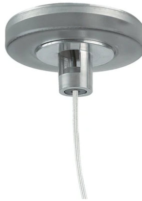
Power supply rose 08.0031.00