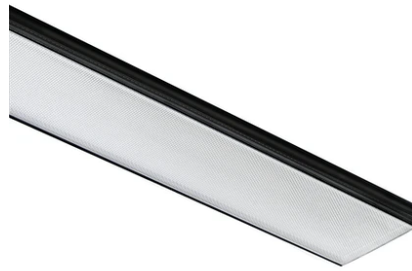
500 mm micro-prismatic diffuser. Highly efficient multilayer diffuser that, thanks to its unique microprismatic texture, provides a glare free UGR<19 light beam 08.0114.00