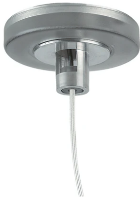
Power supply rose 08.0031.00