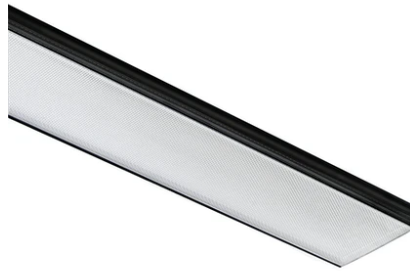
500 mm micro-prismatic diffuser. Highly efficient multilayer diffuser that, thanks to its unique microprismatic texture, provides a glare free UGR<19 light beam 08.0114.00