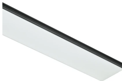
500 mm opal diffuser. Diffuse, glare free and uniform lighting throughout the room 08.0111.00